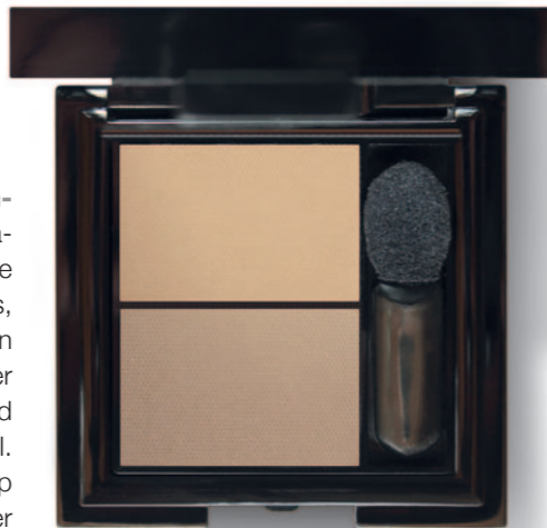
Infinity Eye Shaper ist ein Allrounder: Die zwei aufeinander abgestimmten Farbtöne können als Brauenpuder, Lidschatten oder zum Akzentuieren der Augenkonturen eingesetzt werden. 36 €, www.horst-kirchberger.de

„Da die Haut nach Krebsbehandlungen derart mitgenommen ist, empfehle ich immer, beim Schminken keine Schichten aufzubauen, sondern erst einmal einen silikonfreien Primer zu benutzen. Sie sind in diesem Fall oft