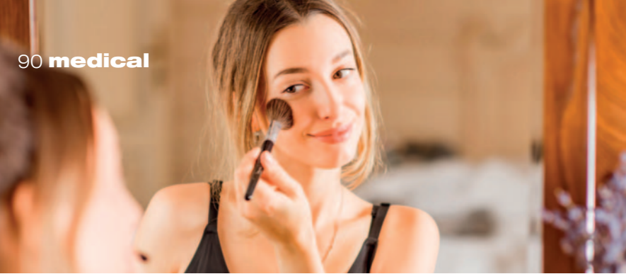
Pinsel und Schwämmchen sollten nach Gebrauch ausgewaschen werden, damit sich keine Bakterien bilden können.