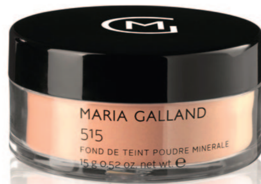
Foundation und Mineralpuder in einem mit pflegendem Effekt dank Allantoin und Arginin. Gleicht die Haut aus und mattiert, besonders für unreine, ölige und empfindliche Haut. 50 g 38 €, gesehen bei www.tagesfarm-muenchen.de

Besonders bei der Strahlentherapie sollte der bestrahlte Hautbereich nur mit lauwarmem Wasser gewaschen werden – ohne Seife! Die Haut anschließend nur vorsichtig trocken tupfen. Ansonsten sind milde, parfümfreie und feuchtigkeitsspendende Hautpflegeprodukte zu empfehlen. Neben der sehr trockenen und lipidarmen Haut (juckt und schuppt) liegt häufig eine gestörte Hautbarriere vor. Ein mildes Reinigungsgel sowie lipidhaltige Cremes zur Stärkung der Hautbarriere bieten sich hier für die tägliche Pflege an, beim Hand-Fuß-Syndrom spezielle Hand- und Fußpflegecremes benutzen. Leiden Sie unter akneähnlichem Ausschlag und Pickel, dann sollten Sie die für